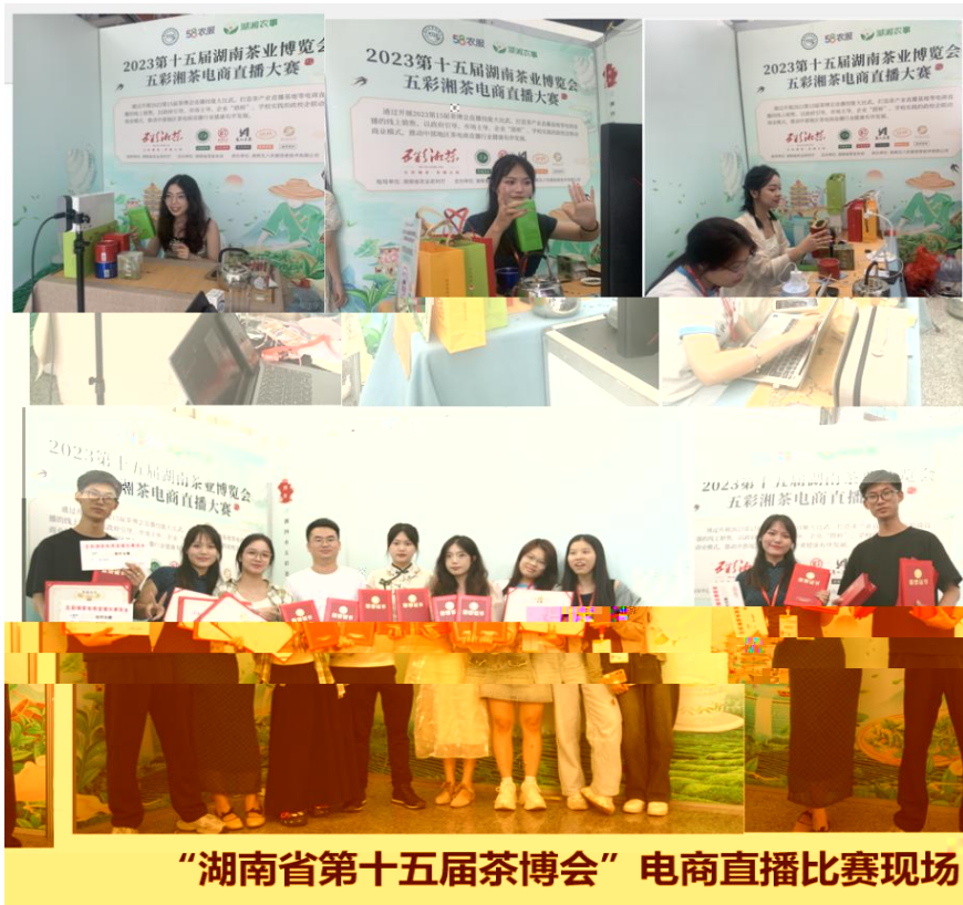
“湖南省第十五届茶博会” 电商直播比赛现场